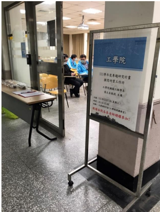
專題研究計畫撰寫研習工作坊海報