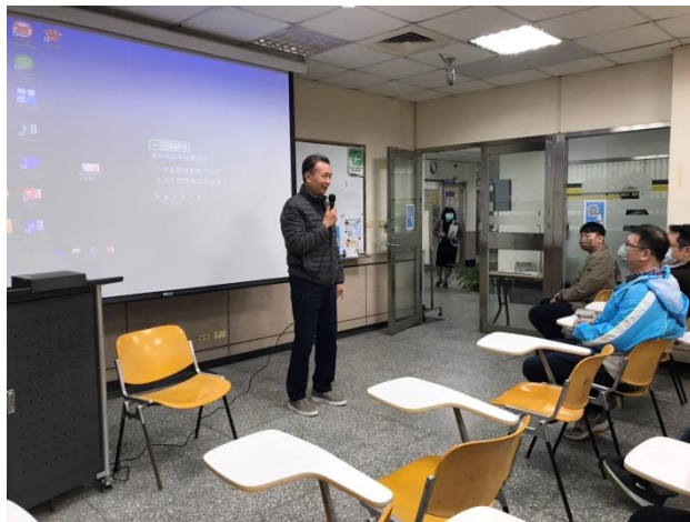
陳院長開場致詞介紹主講人的情形